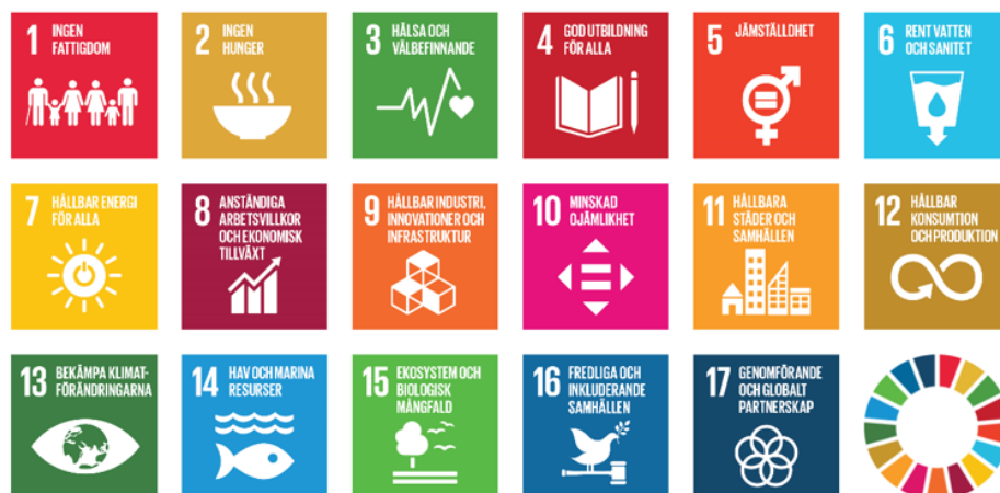
Figur 1. FN:s globala mål för hållbar utveckling

Eftersom förutsättningarna för att nå de 17 målen är lokala, medan målen är globala, blir varje lands utmaningar och styrkor unika. Det som sker på den lokala nivån är centralt för genomförandet av agendan. Gävle kommuns miljöstrategiska program ska bidra till att nå de 17 globala målen.