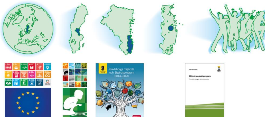
Figur 2. Styrande dokument från globalt till lokalt för Gävles miljöarbete.

När målen i det Miljöstrategiska programmet har tagits fram har de globala målen, de svenska miljömålen och Gävleborg läns miljömål varit en utgångspunkt. Gävle kommunkoncern har sedan gjort sin prioritering. Se figur 2.