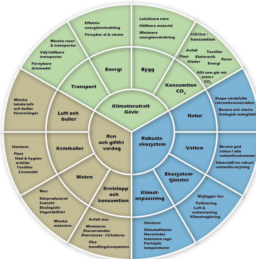
Figur 5: Målområden och vad som ska fokuseras på inom respektive målområde.

Till varje mål finns en eller flera indikatorer. Indikatorerna används som underlag för att följa utvecklingen. Politiken behöver regelbundet följa upp arbetet för att säkerställa att de insatser som genomförs är tillräckliga eller om mer behöver göras och prioriteras för att nå de beslutade målen.